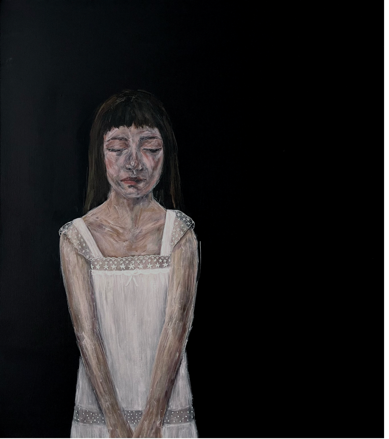
küçük 70x80cm tuval üzeri akrilik ve iğne işi nakış 2024