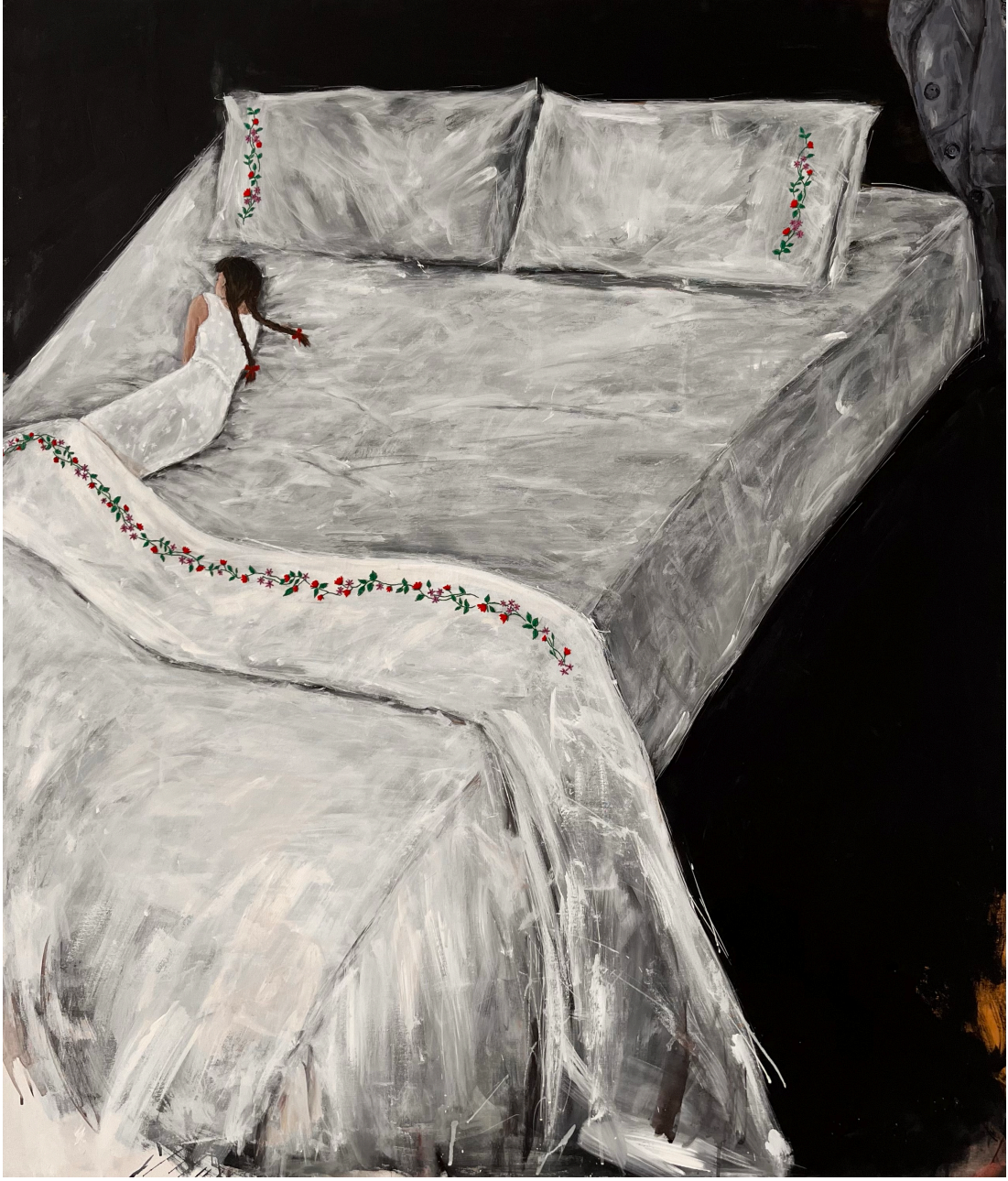
gece 120x140cm tuval üzeri akrilik ve iğne işi nakış 2024