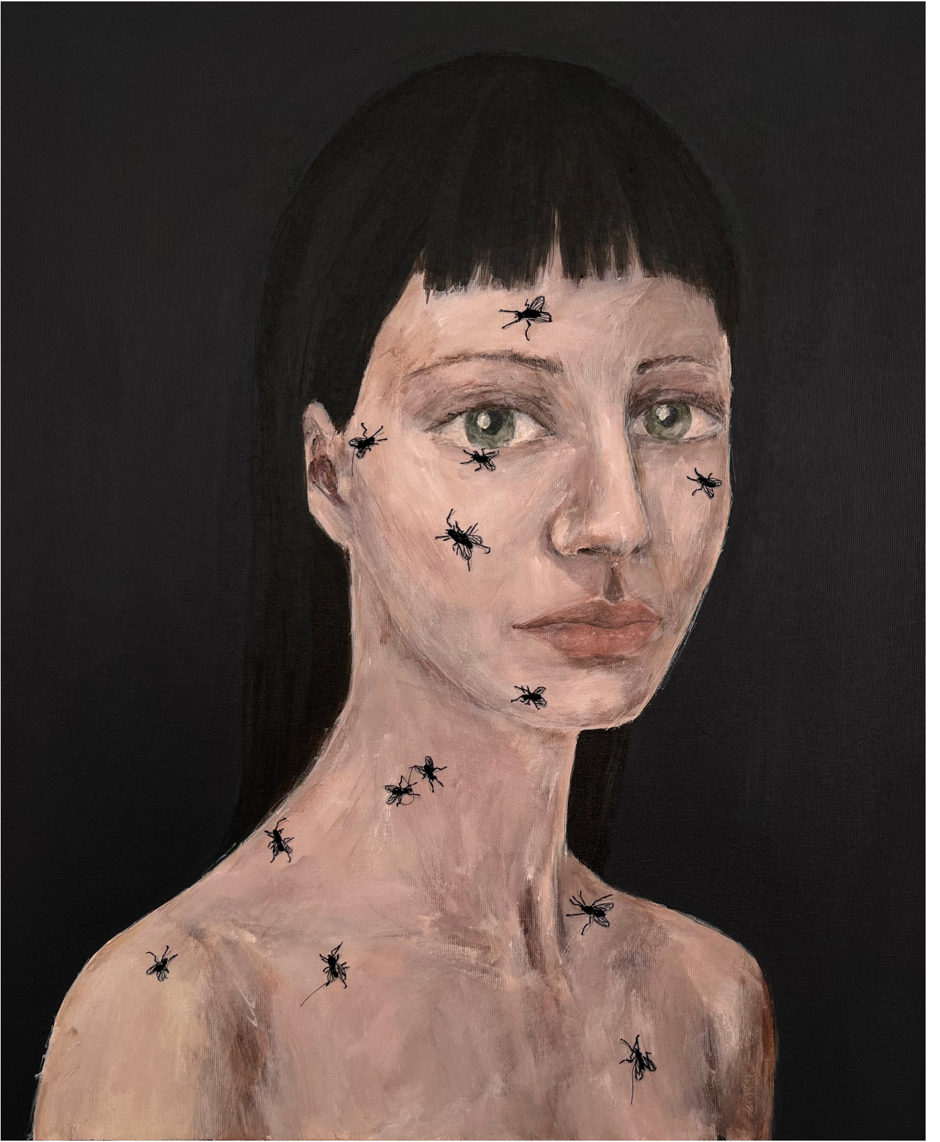
Sinek 50x60cm, tuval üzeri akrilik ve iğne işi nakış, 2024