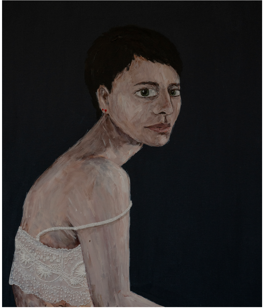
Zeynep 60x50 cm Tuval üzeri akrilik ve iğne işi nakış 2022