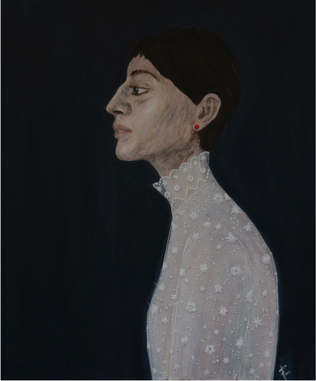
Sorrow 60x50cm Tuval üzeri akrilik ve iğne işi nakış 2022