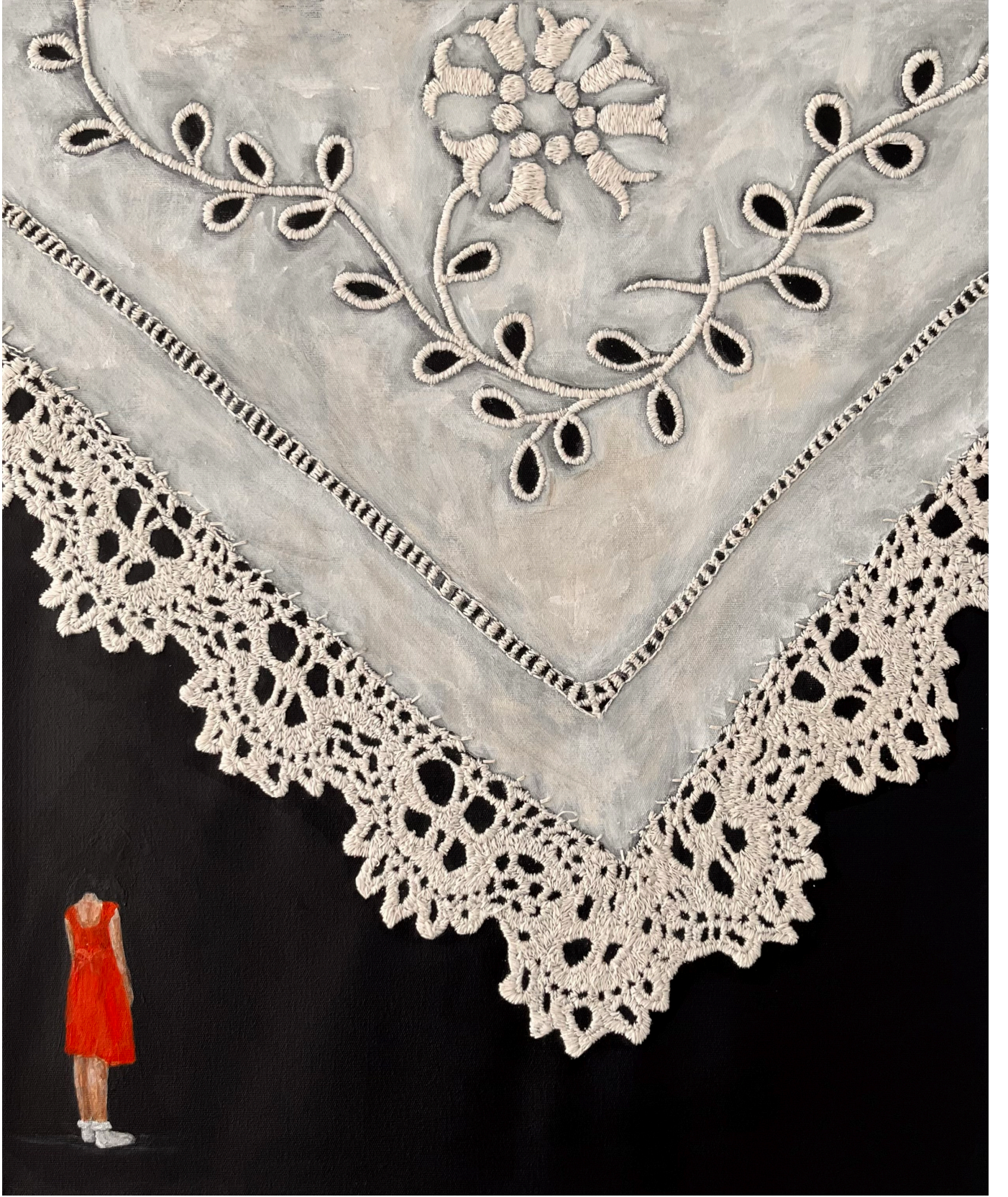
beni harika bir hayat bekliyor 50x60cm tuval üzeri akrilik ve iğne işi nakış 2024