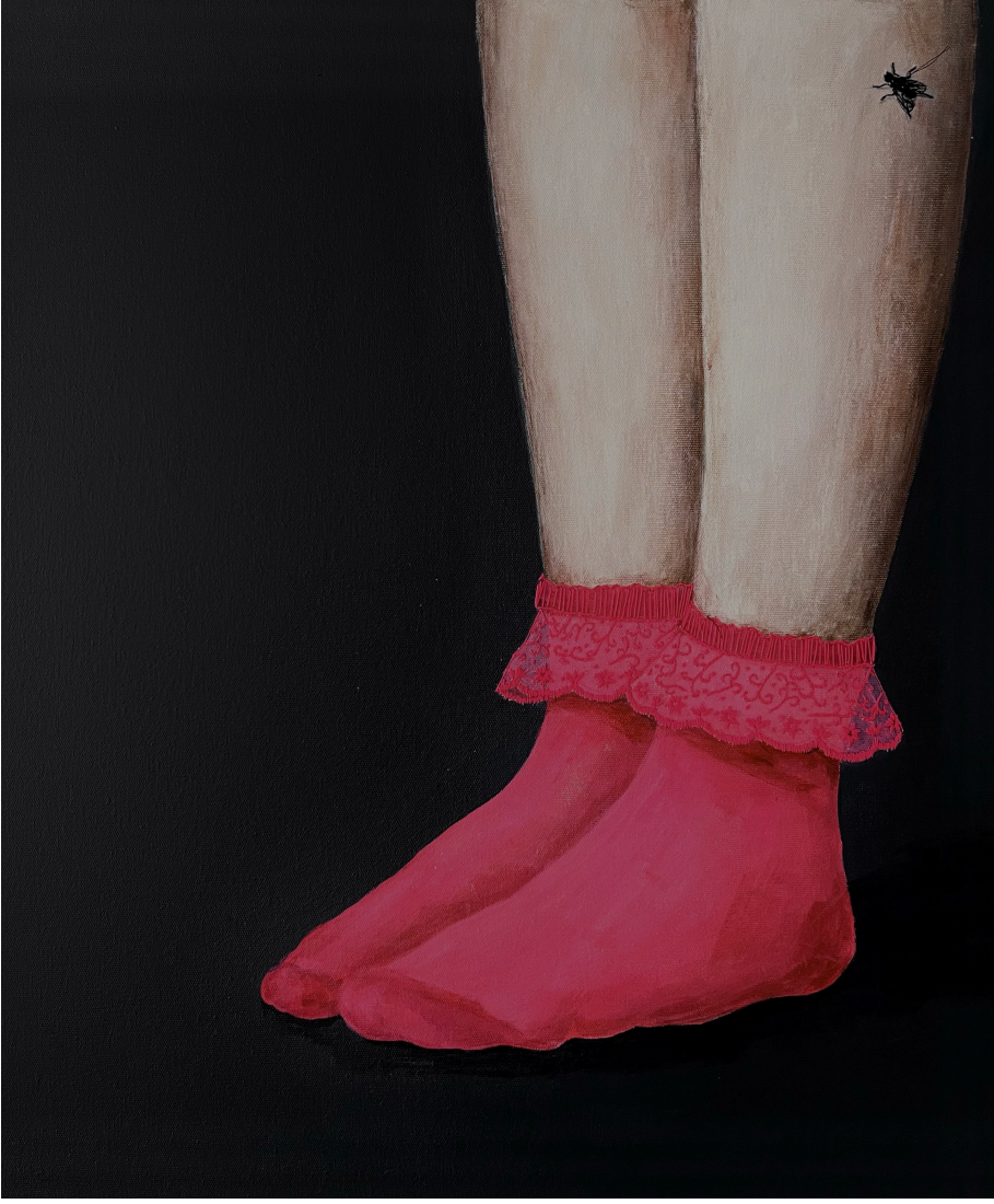
İsimsiz 50x60cm, tuval üzeri akrilik ve iğne işi nakış, 2024