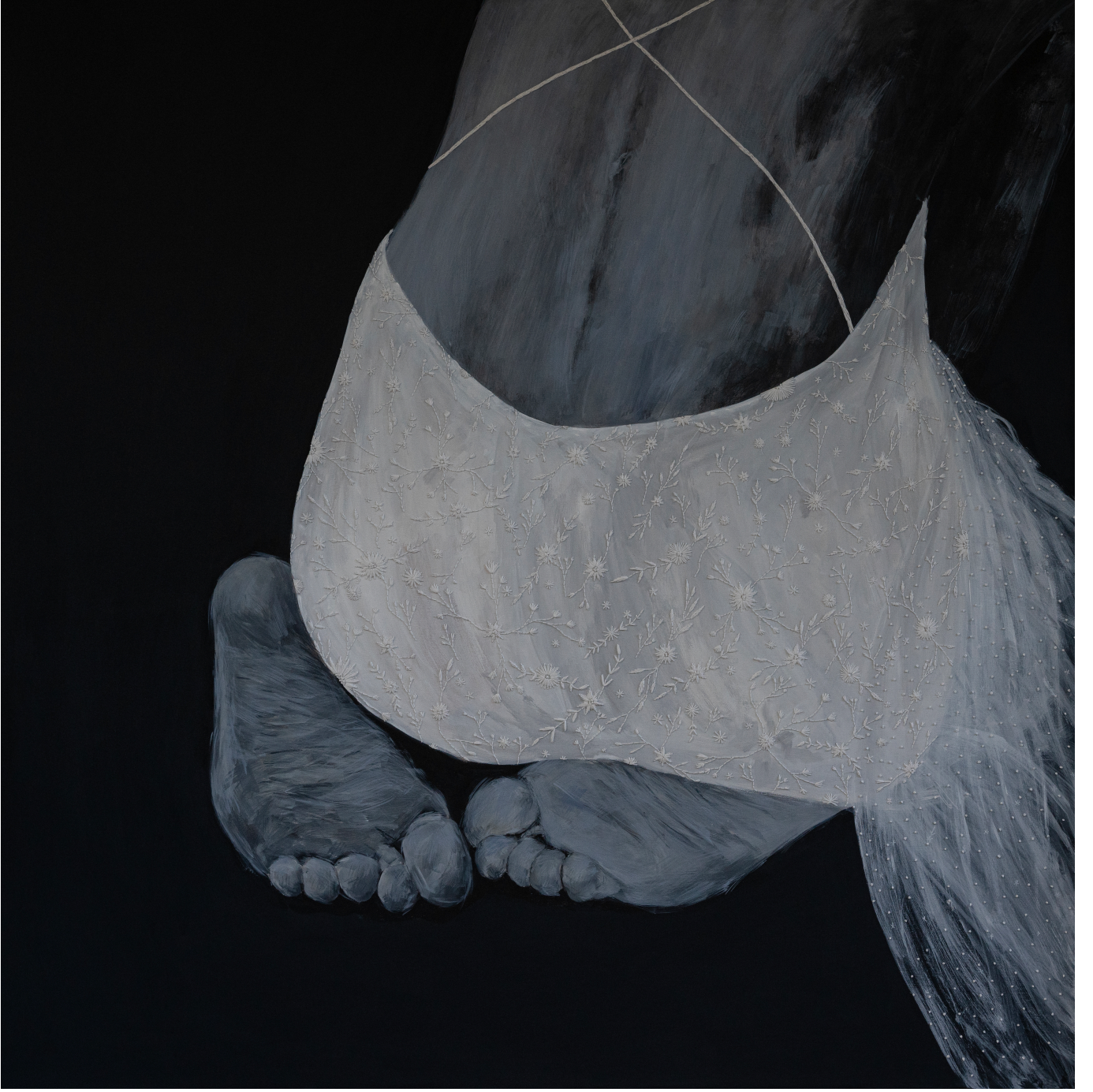
Winter 130x130 cm Tuval üzeri akrilik ve iğne işi nakış 2022