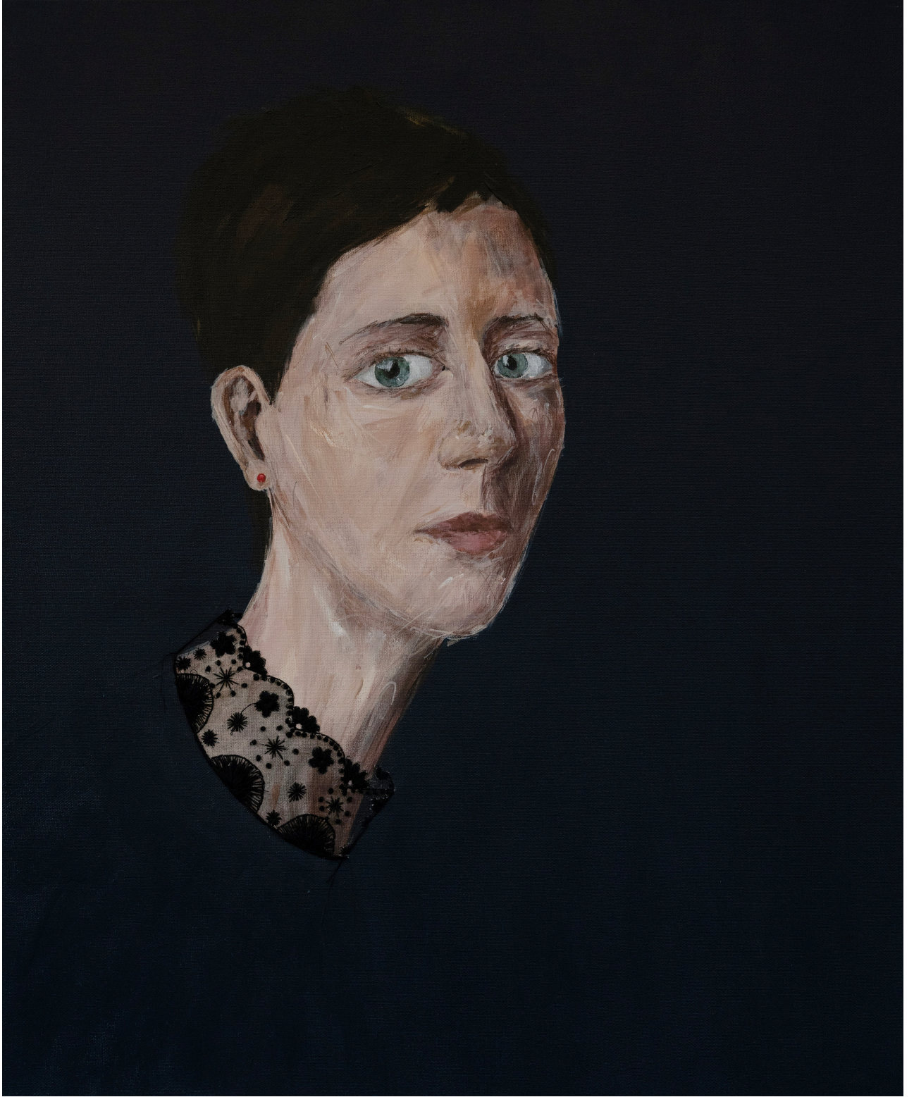
The Woman in the library 60x50 cm Tuval üzeri akrilik ve iğne işi nakış 2022