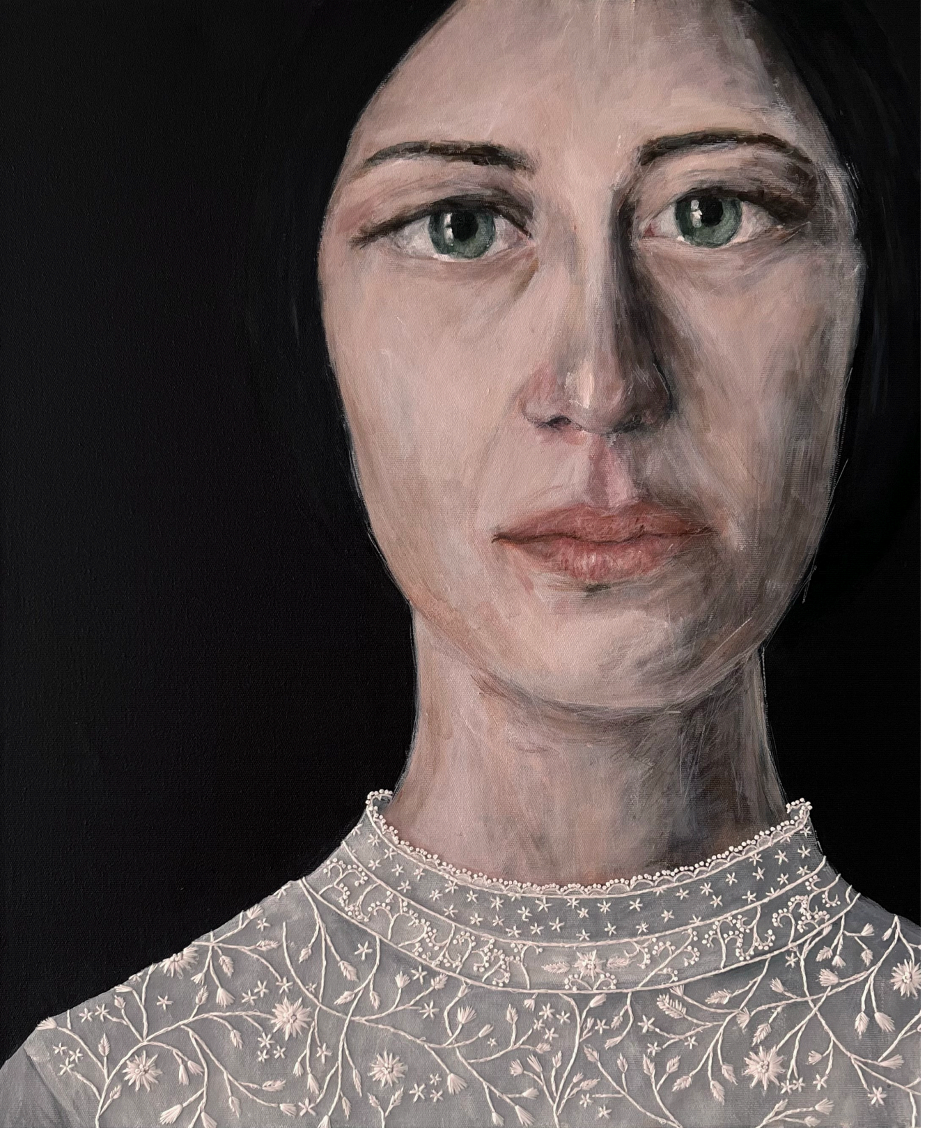
küs 50x60cm, tuval üzeri akrilik ve iğne işi nakış, 2024