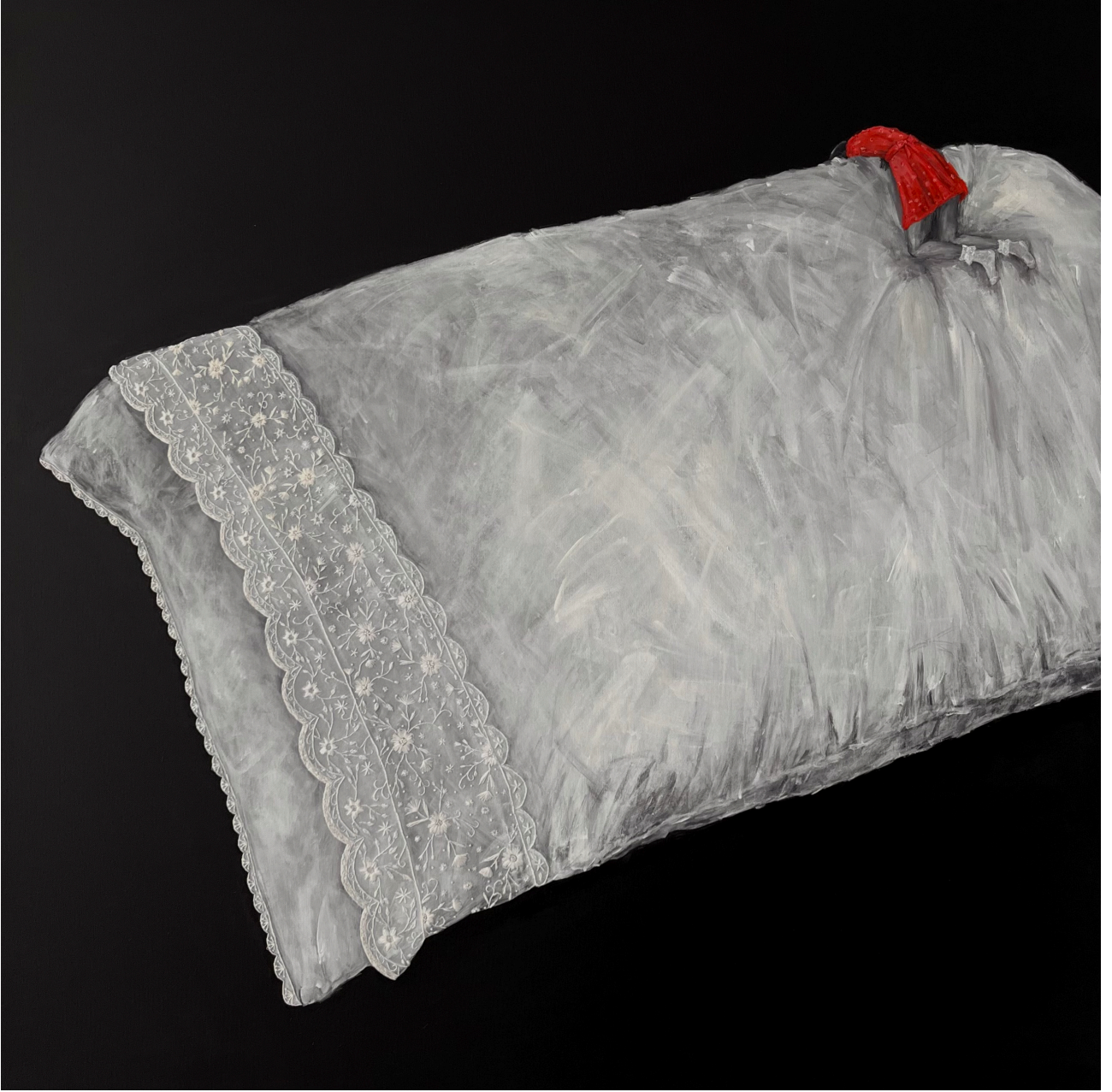
isimsiz 130x130cm tuval üzeri akrilik ve iğne işi nakış 2024