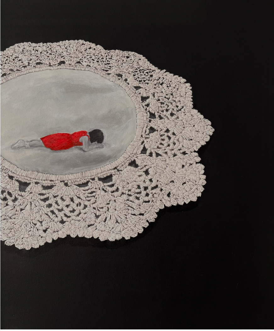
eyizini gster bakalım 50x60cm Tuval zeri akrilik ve ięne iři nakıř 2024